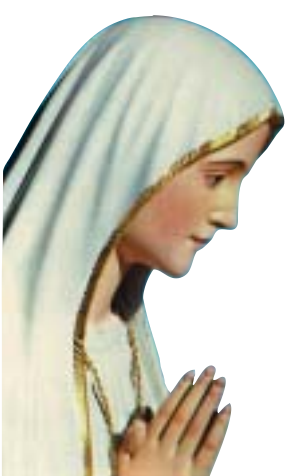
Notre Dame de Fatima